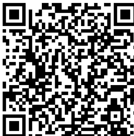
Tableau d'informations numérique